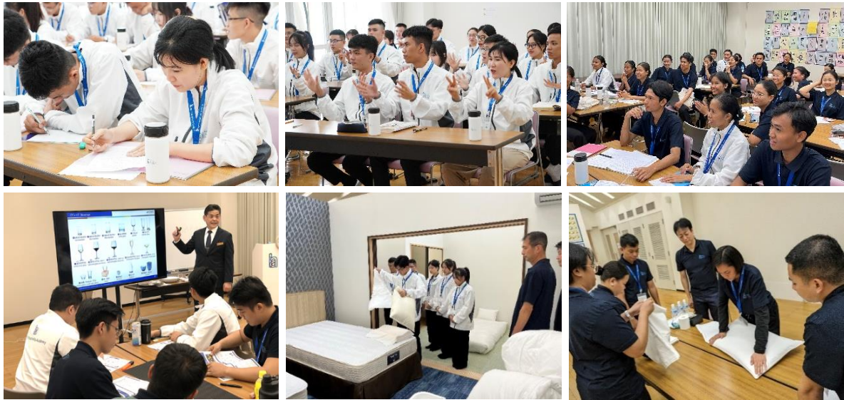
(入国後講習修了後の OFF-JT によるルームメイキング研修の様子)