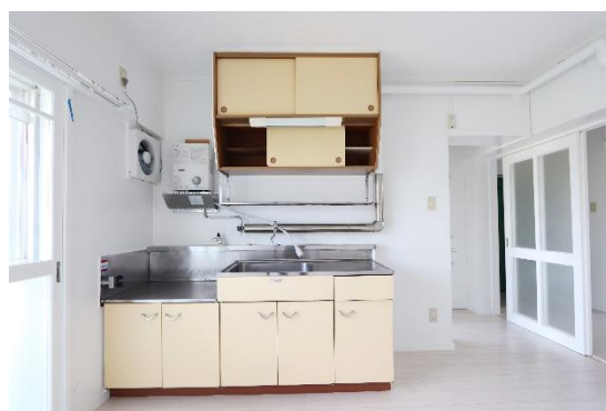
躯体を活かし、内装を一新した「ビレッジハウス黒石」